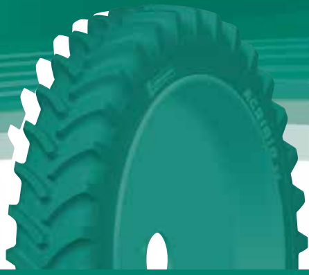
Bandenspanning in (bar) en (psi) - Belasting per band in kg (1)