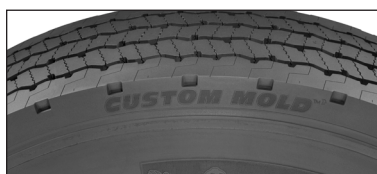
X MD LINE ENERGY D Custom Mold