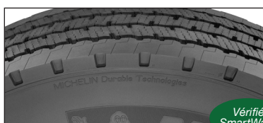
Nouveau Pneu X MD LINE ENERGY D