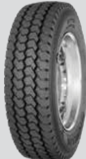
X® WORKS™ HD Z