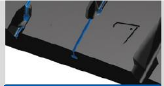
レジニオンテクノロジー (ミシュランモールド3D マルチプリンティングテクノロジー)