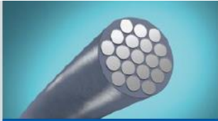
パワーコイルテクノロジー (205/65R17.5を除く)